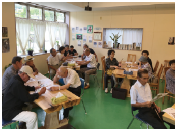
(A) 営農・特産化講習会

じねんじょう山芋を使った営農戦略・経営指針、及び地域特産化に対するモデル事例と6次化展望の紹介。